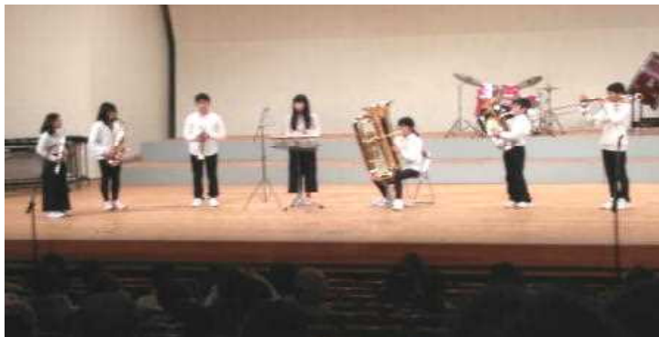
＜管打八重奏の演奏の様子＞

私たち吹奏楽部は、毎日グループに分かれてたくさん練習してきました。曲は、私たち6年生を中心にきめました。自分たちで調べ、曲を聴きました。聴いた曲はどれもむずかしそうでした。曲を聴いているとき、私は心の中で「がんばろう」って思いました。朝練、帰練では何回も曲を演奏しました。始めは曲を聴き、覚えるのが大変でした。みんなに迷惑をかけたくなかったし、足を引っぱりたくなかったのでたくさん練習しました。先生からたくさんのアドバイスをもらいました。「音を大きく」「もっと速く」などたくさん注意されました。でも、そのおかげで上手になったと思います。練習でグループの仲が深まりました。仲間はとっても大切だと思いました。いっしょにがんばってきたグループのみんな、先生方のおかげでたくさん成長できたと思います。